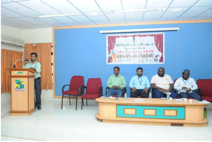
இந்திய விடுதலைப் போராட்டத்தில் இஸ்லாமியர்களின் பங்களிப்பு என்ற தலைப்பில் உதவிப் பேராசிரியர் திரு ல. அ. முகமது அலி ஜின்னாஹ் அவர்களின் பொழிவு